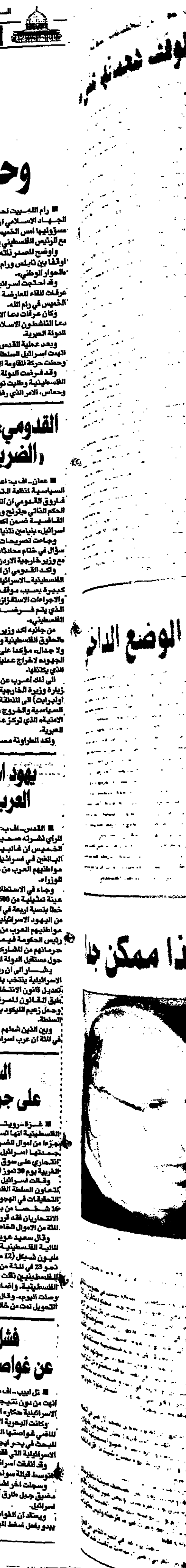
لوفت شيفت في غير

■ القدس - في بيان صادر عن وزارة الدفاع الاسرائيلية، أعلنت ان ننتياهو يعيد برنامج كومبيوتر مخصصة لاولاد الفقراء. وقالت الوزارة ان هذا البرنامج يهدف الى توفير التعليم لاولاد الفقراء. وقالت الوزارة ان هذا البرنامج يهدف الى توفير التعليم لاولاد الفقراء.